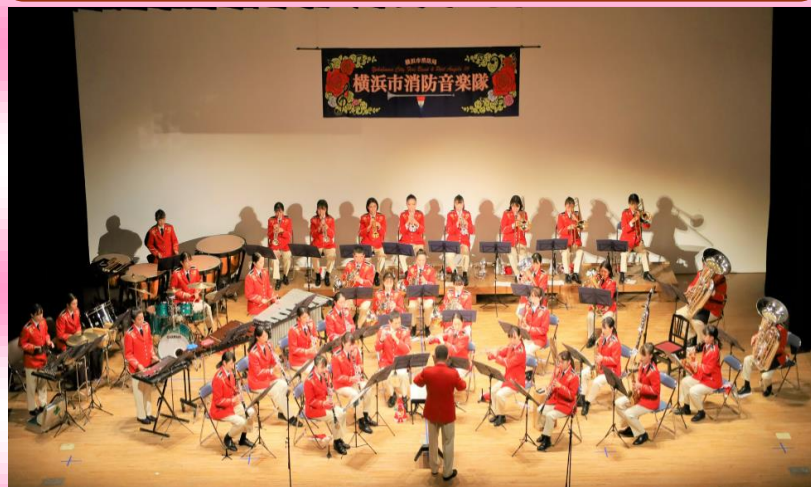
横浜市消防音楽隊 プロフィール