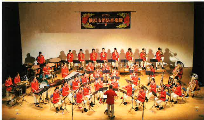
横浜市消防音楽隊 プロフィール